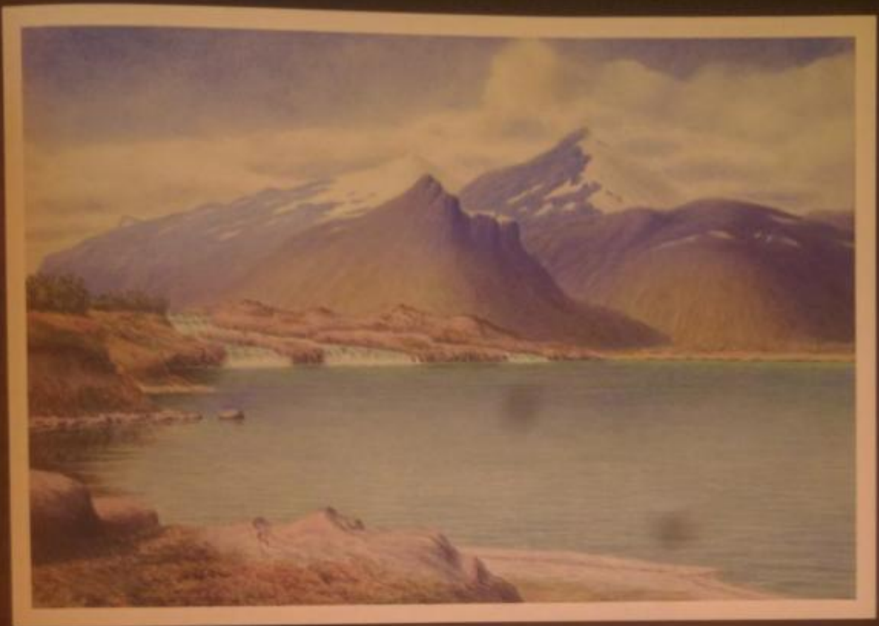
Stora Sjöfallet med fjället Nieras i bakgrunden. Målning av Gudjohnsen.