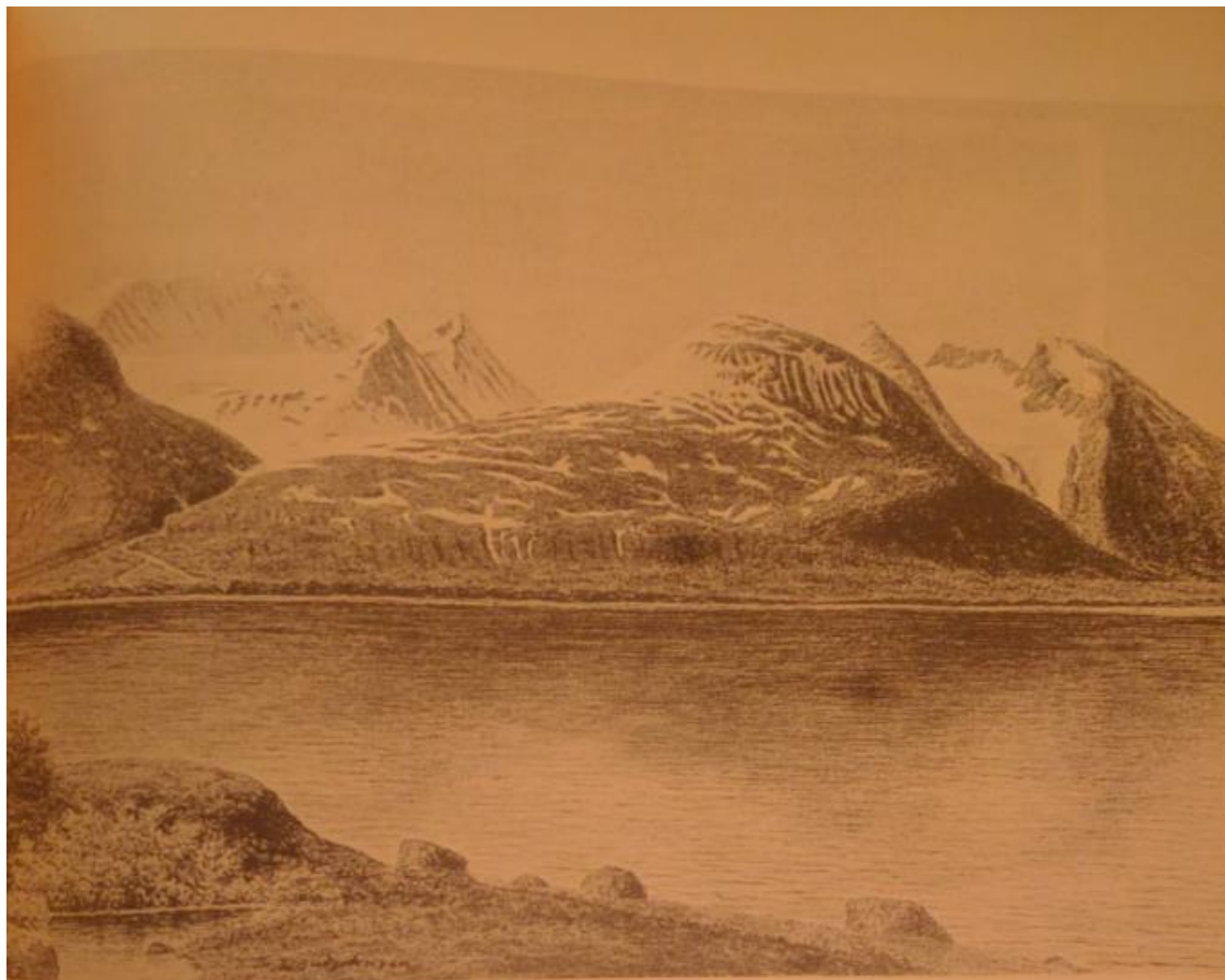
Akkamassivet från norr, teckning av Gudjohnsen.

dalen mellem Kallaktjåkko og Svalaliesotjåkko, Lengre inde i dalen, Stortoppen mot vest, Kedlen med Nordostbreen, Mot nv over Autajaure og Sitasjaure — och så vidare, kortfattat och exakt. Här talade egna erfarenheter, och vädret var uppenbarligen för det mesta till sin fördel när han utforskade massivet, att döma av bildmaterialet.