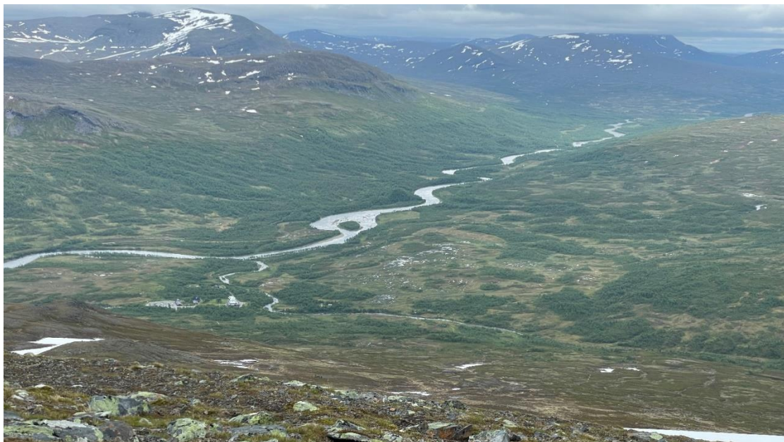
Uppe på Getryggen. I bakgrunden Ånnsjön och därbortom Åreskutan

Vår reservdag. Vädret ser bra ut så vi bestämde oss för att gå upp på Getryggen. Det var mycket uppför och vi hamnade precis i kön efter ett par andra grupper. Men efter ett tag blev vi mer utspridda och vi kom upp som andra sällskap till toppen. Utsikten var magnifik, mot norr Ånnsjön och Åreskutan, åt söder Sylarna. Vi åt lite godis på toppen och sparade lunchen till nervägen. På vägen ner gick vi förbi fjällstationen och köpte glass och en pilsner. Det var vi värda efter dagens bestigning. Vi kom åter till tältet vid femtiden och hann med kvällsmaten innan regnet kom.