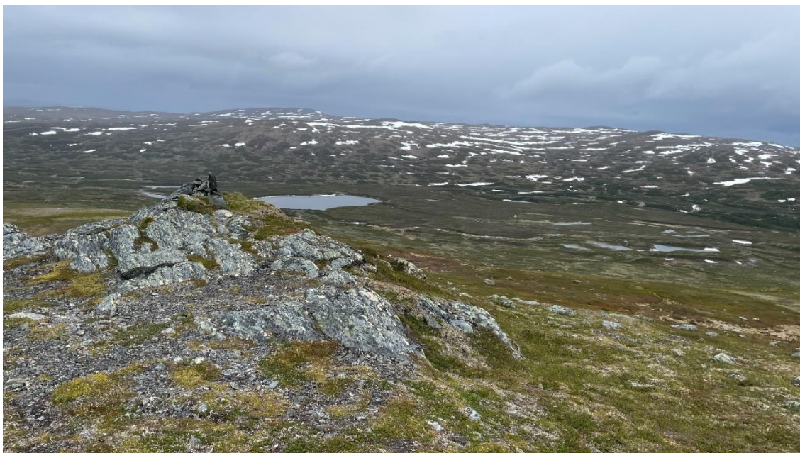
Utsikt från Stor-Ulvåfjället västerut mot Blåhammaren, uppe t.v. i bild syns Ulvåtjärn.

Dagens väderprognos sa regn mest hela dagen och tilltagande framåt eftermiddagen. I dag blev det en tur österut. Stor-Ulvåfjället var målet. Vi tog det lugnt med frukosten men kom ändå iväg vid halv tiotiden. Vi rundade sjön och följde leden mot Enkålen någon kilometer innan vi vek av österut upp i sluttningen. Det blev ett par pauser, det mjuka underlaget och sluttningen uppåt tog ut sin rätt, men så småningom nådde vi upp till toppen. Vi hade sikt och kunde se det annalkande eftermiddagsvädret komma från Norge. Vi tog en snabb fika/lunch i lä bakom en klippa precis under toppen. Sedan var det dax för hemfärd så vi skulle försöka undvika det värsta regnet. På vägen ner passerade vi en stor flock renar strax innan vi nådde leden. Regnet kom när vi nådde sjön, vi rundade sjön och blev bara lite fuktiga då vi kom fram till tältet strax efter 12. Vi tillbringade resten av dagen i ett regnsmattrande tält.