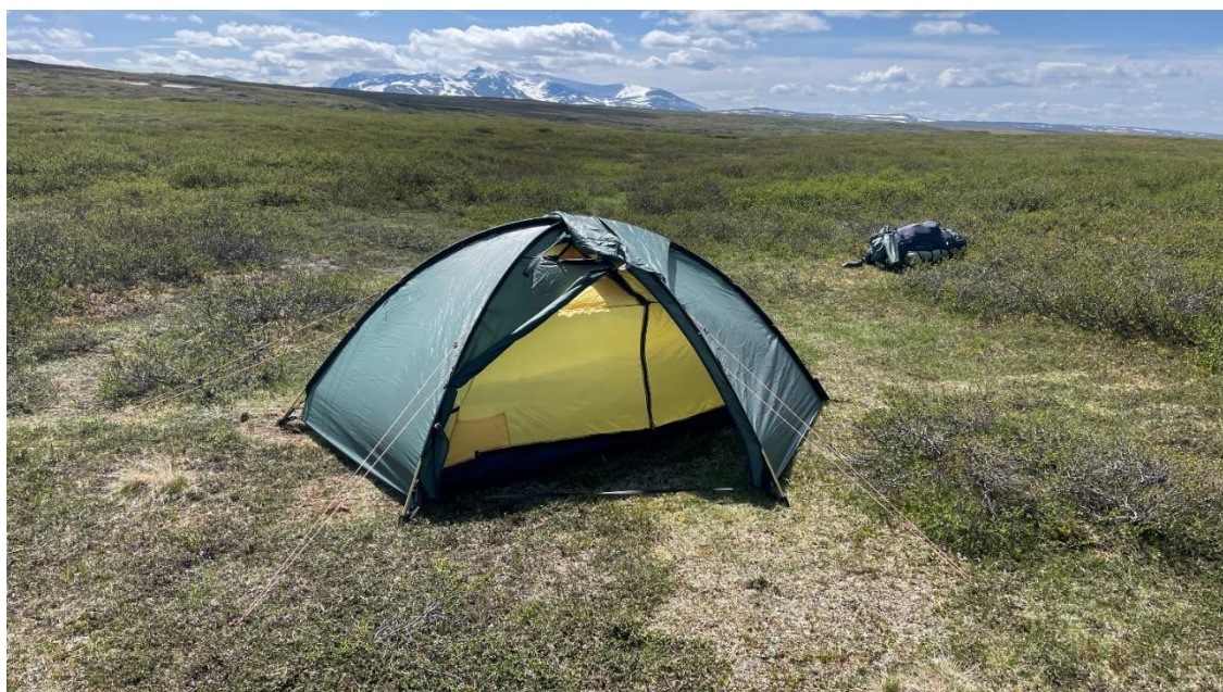
Lägerplats väster om Ulvåtjärn. I bakgrunden Sylarna.

Jag vaknade i Östersund, gick och köpte morgonkaffe på tåget. Bara några timmar kvar till Enafors där vi gick av och bytte till anslutande taxi för att ta oss sista biten till Storulvåns fjällstation. Framme i Storulvån fixade vi till packningen och lämnade lite bagage inför hemresan innan vi ivriga började vandringen söderut över bron. Vid ledskiljet tog vi av västerut mot Ulvåtjärn och Blåhammaren. Vårt mål för dagen var Ulvåtjärn ca 7 km, där vi skulle slå upp vårt tält väster om sjön för några dagar. Efter tältresning, lunch och lite vila var det dax att bekanta oss lite med omgivningarna. Vi gick bort till rastskyddet och kombinerade det med träna att korsa bäckar (jokkar). Vi korsade Ulvån ett par gånger på vägen. Sista gången vid vadstället blev det en blöt strumpa. Tillbaka vid tältet blev det kvällsmat och en liten kvällspromenad innan läggdags. Vi var trötta efter en lång resa. Vädret var fint.