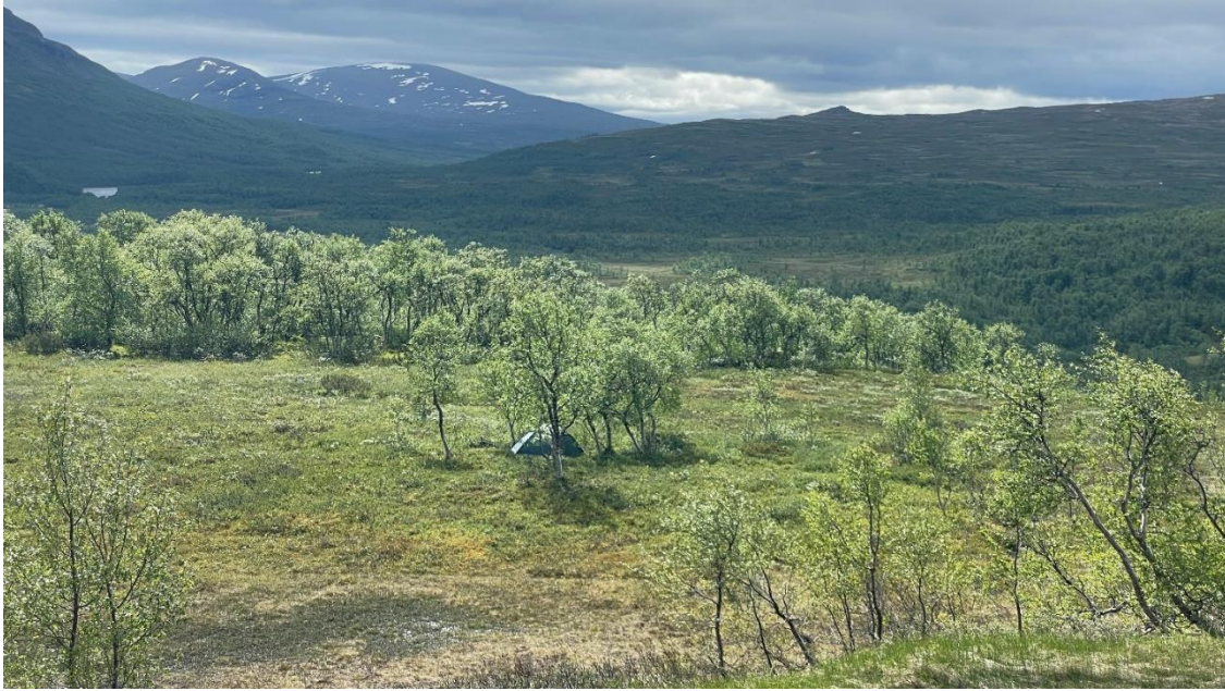
Lägerplats ca 1 km väster om Storulvån.