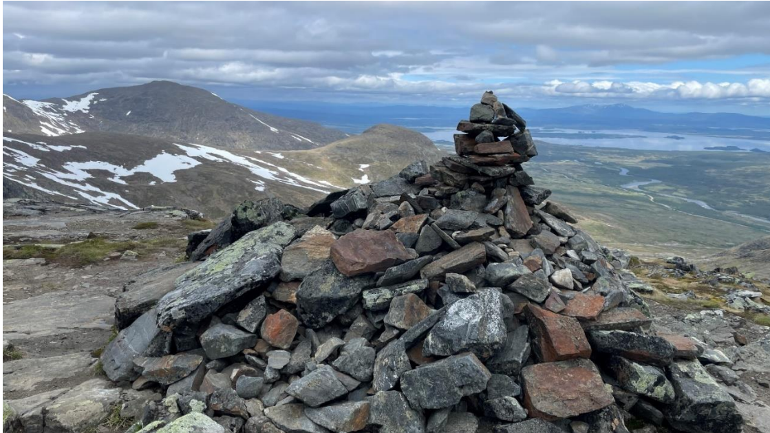
Storulvån t.v. med Handölan sett från Getryggen. I bakgrunden Bunnerfjällen.

Hemresedag. Vi väntade tills det slutade regna vid niotiden på morgonen innan vi gick upp och åt frukost. Vi packade ihop inne i tältet och tog ner det blöta tältet när allt var klart. Gick den sista kilometern ner till Storulvåns fjällstation dit vi kom vid elva tiden. Gått om tid innan bussen till Enafors skulle gå strax innan tre. Vi duschade, bytte om och åt lunch på fjällstationen. Vi fick samma vagn och platser på tåget hem som vi hade på ditresan.