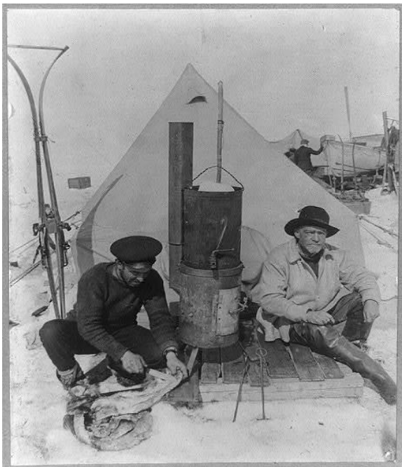
Ernest Shackleton till höger.

Frank Wild, till vänster. Bitr exp ledare,