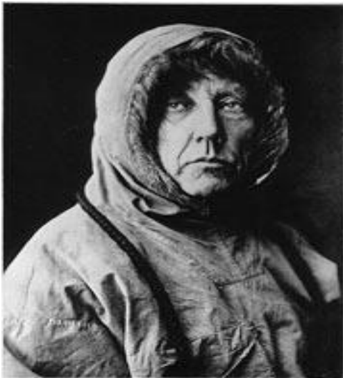
Roald Amundsen, Ateljébild, 1910